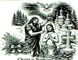
Christ is Baptized! In the river Jordan!

Christ is Born! Let us glorify Him! Happy New Year!